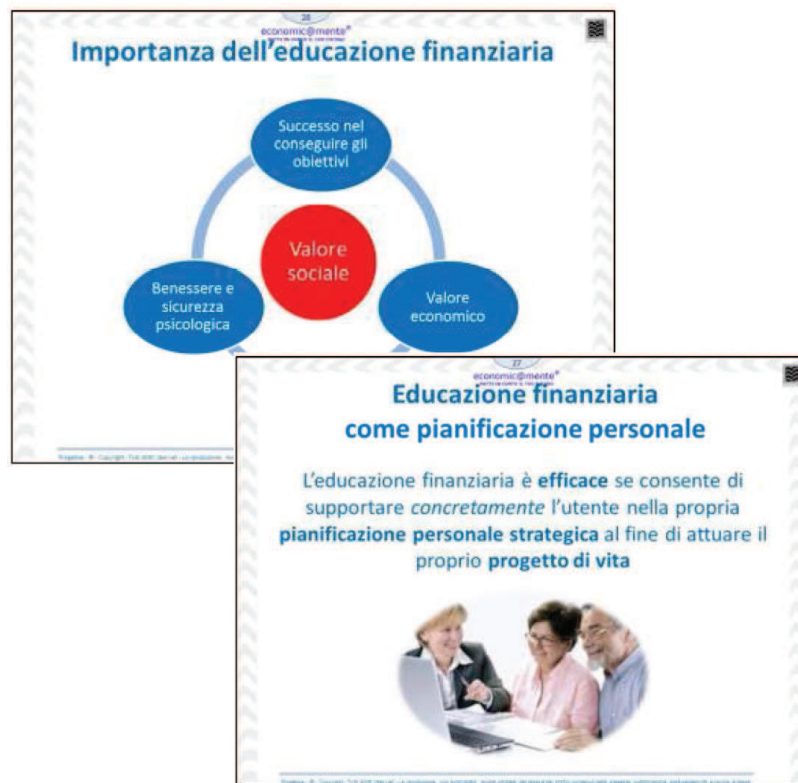
Modulo 4. Slide 26-27 L'importanza dell'educazione finanziaria e le condizioni per la sua efficacia.