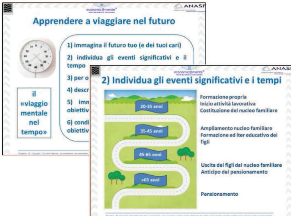
Modulo 1. Slide 20-22.

Il processo di apprendimento all'utilizzo del pensiero-futuro.